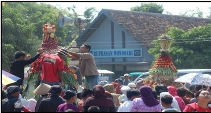
Photo.6. Rasulan Desa Kepek

Kejawi Upacara Adat Rasulan, adat sanesipun ingkang taksih lumampah lan dipun lestantunaken wonten ing Desa Kepek wonten inggih menika Tingkepan, Selapanan, Tedhaksiten, Mantu, 7 dina, 40 dina, 100 dina, Mendhak Pisan, Mendhak Pindho lan 1000 dina ). Kagem kadang tani taksih wonten Adat Wiwit lan Methik. Lan ugi wonten Gumbregan kagem ngemong-mongi sato kewan ingon-ingon.