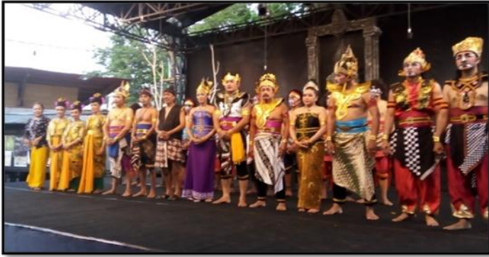
Photo.7 Kethoprak Marsudi Budhoyo

Sakwetawis potensi Kebudayaan wonten ing Desa Kepek saget kita aturaken :