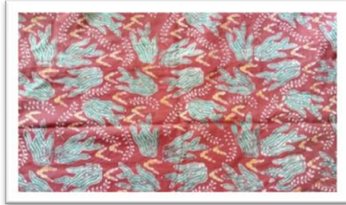
Photo.8. Motif Batik Manding Kepek