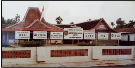
Foto 19. Balai Desa Kepek