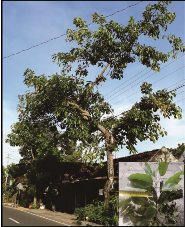
Foto.10. Wit Kepek

setunggal wit 4 , jalaran Desa Kepek ingkang rumiyen alas wegda sakmenika samun dados kota.