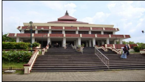
Photo.4. Masjid Agung Al-Ikhlas