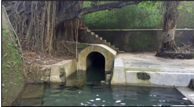
Photo.2. Sumber Belik Pancuran

Kejawi menika Desa Kepek ugi nggadhahi sumber toya (tuk) pancuran ingkang mboten nate asat ingkang sakwetawis kangge nyekapi kabetahan warga masyarakat sak kiwa tengenipun.