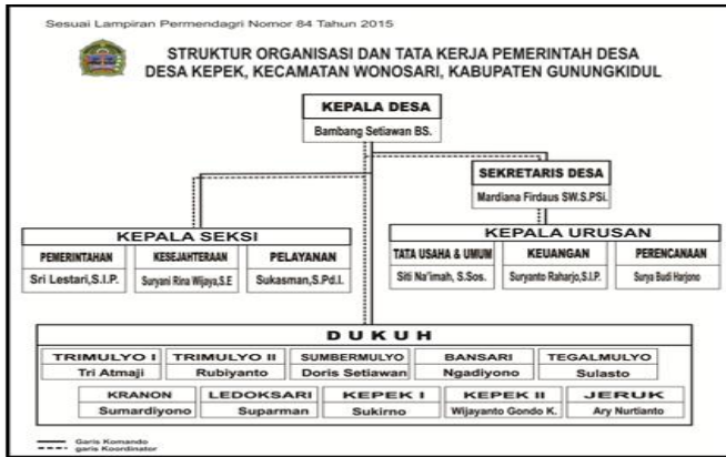
Foto.5. Bagan Struktur Pemerintah Desa