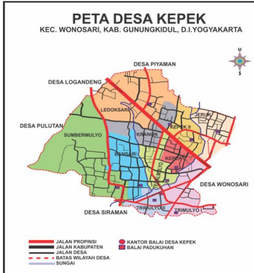
Photo.1. Peta Desa Kepek

lumbet tlatah Desa Kepek, wondene ingkang sisih wetan mlebet tlatah Desa Wonosari.